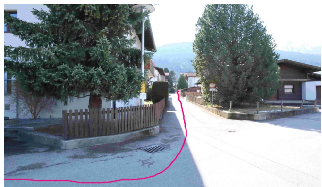
Foto 2 - links hinein - 50 m - das vorletzte Haus Nr. 25 rechts - Ziel erreicht !

Helmut Beringer - 6091 Götzens - Oberer Feldweg 25